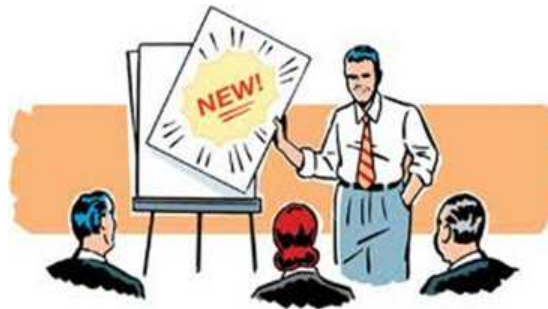
Illustration by Chris Gash